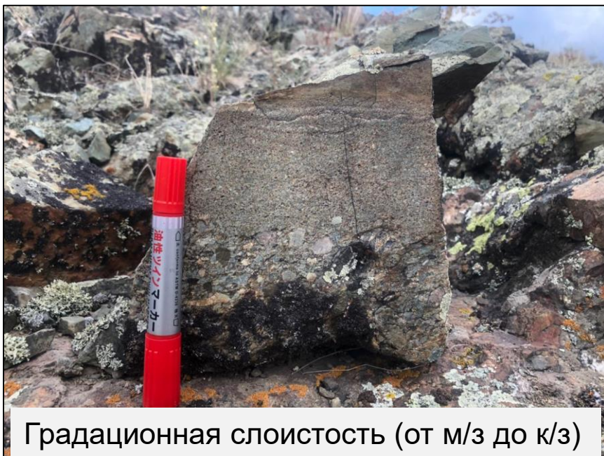
Градационная слоистость (от м/з до к/з)